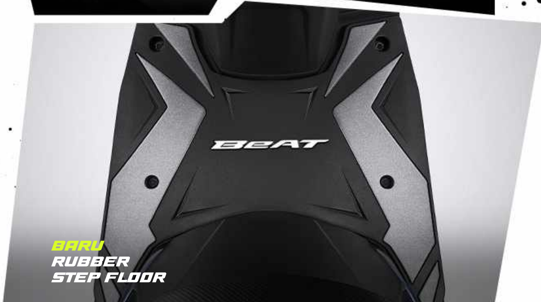
BARU RUBBER STEP FLOOR