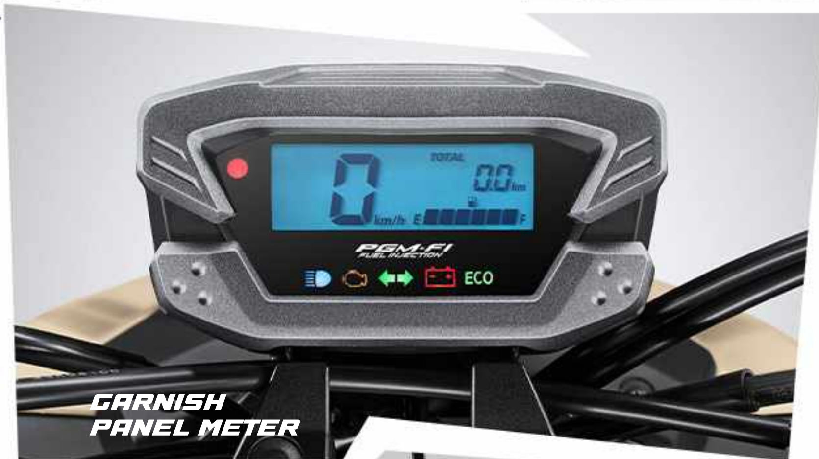
GARNISH PANEL METER