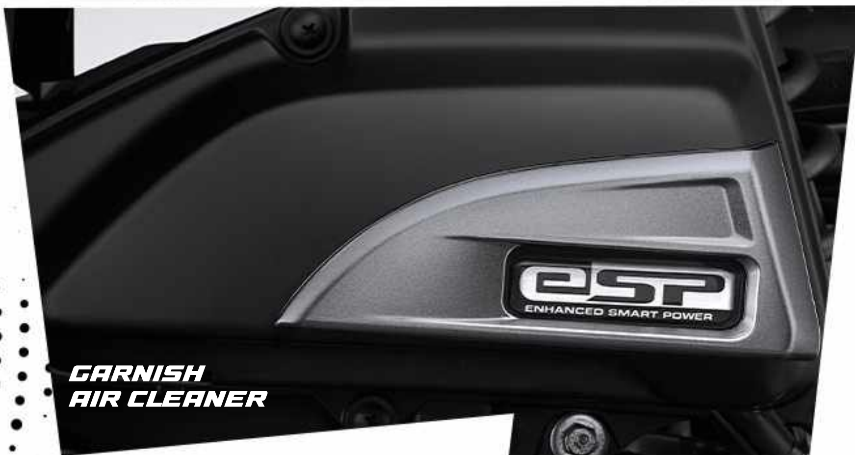
GARNISH AIR CLEANER