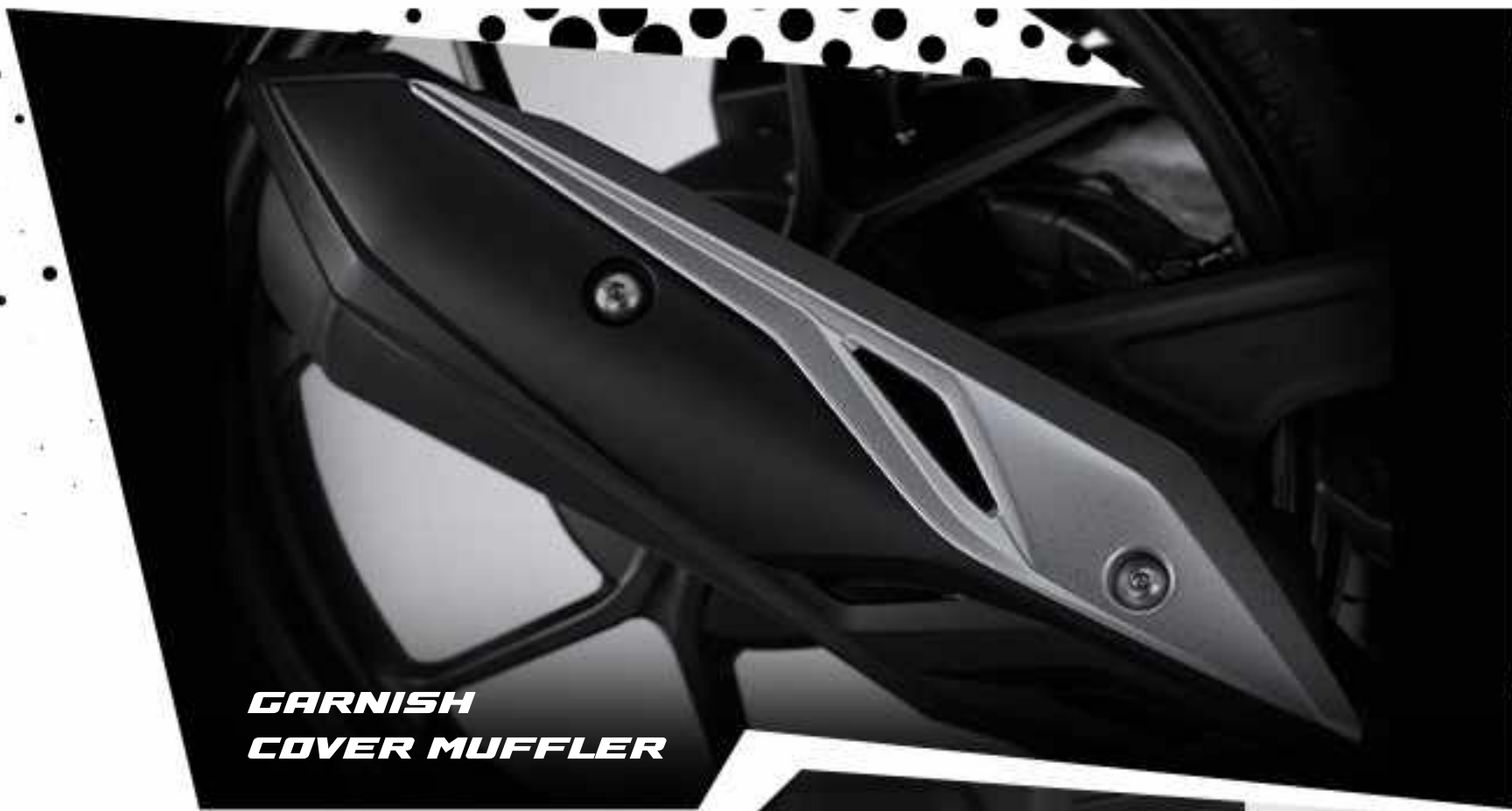
GARNISH COVER MUFFLER