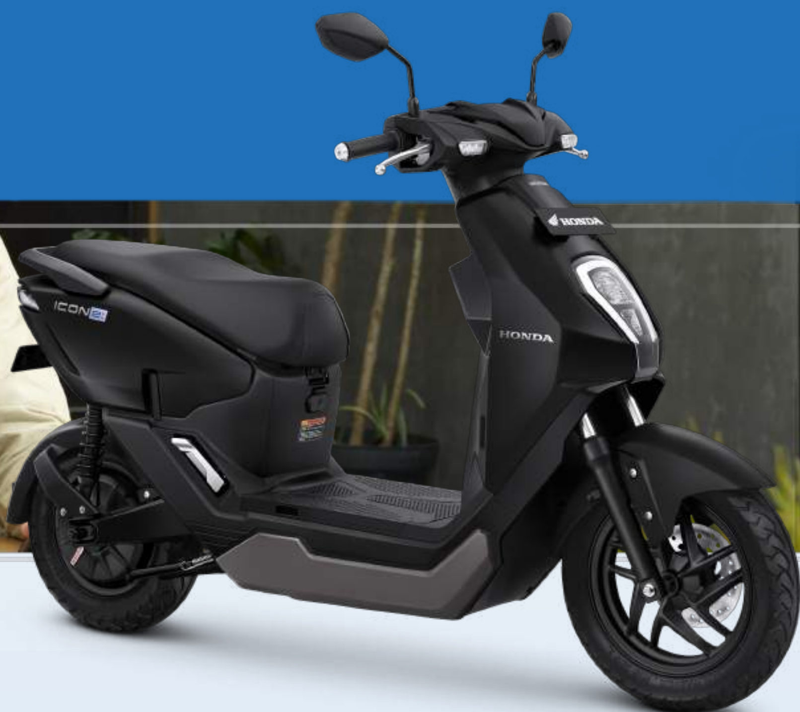
ICONIC MATTE BLACK